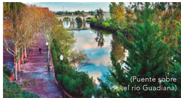
(Puente sobre el río Guadiana)

ca, ofreciendo una amplia variedad de opciones culturales, gastronómicas y de entretenimiento, siendo además uno de los destinos preferidos para los turistas peninsulares, nacionales y extranjeros.