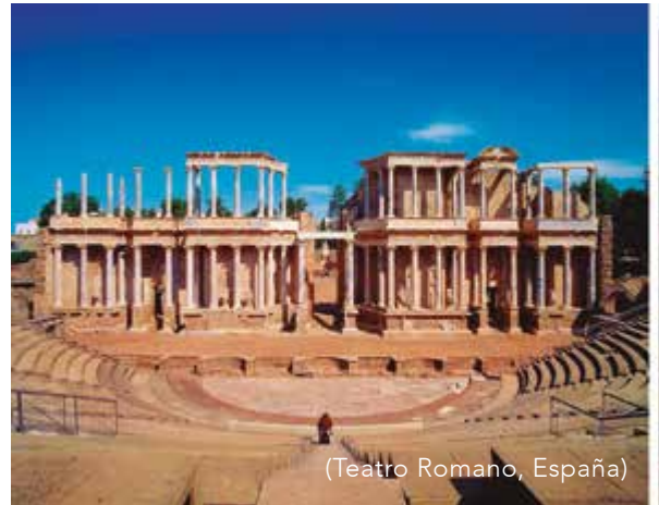
(Teatro Romano, España)

¡La festejada del mes! Fue establecida el 6 de enero de 1542 bajo el nombre de Mérida por Francisco de Montejo "el Mozo"; cuando los españoles llegaron a lo que era la ciudad maya de T'Hó, las construcciones les evocaron a las de la Augusta Emérita, su ciudad natal en España; así, extrajeron las piedras de los edificios locales para la construcción de la nueva ciudad, dando lugar a estructuras como la Casa de Montejo o la Catedral de San Ildefonso. En la actualidad, Mérida se destaca como una de las ciudades más seguras de México y Améri-