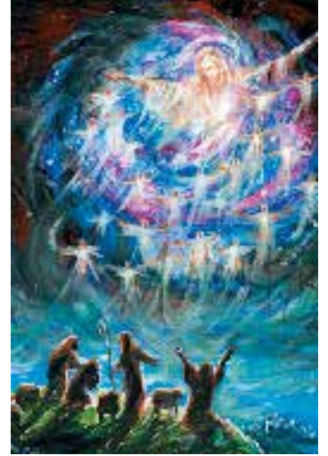
Buenas nuevas de gran alegría Melani Pyke