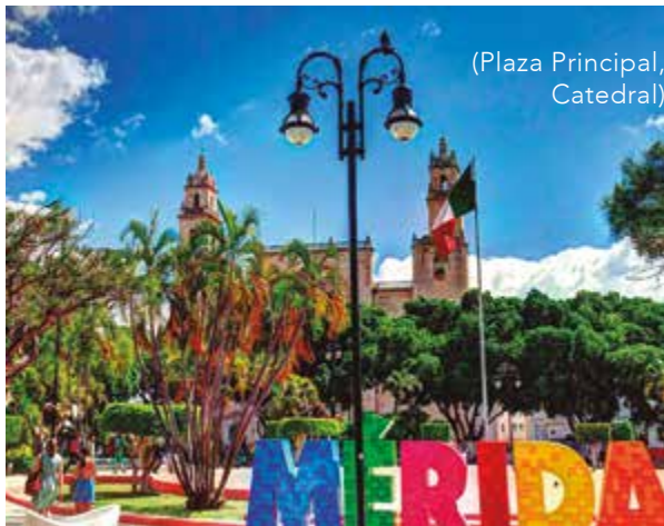
(Plaza Principal, Catedral)

E n el aniversario número 482 de esta ciudad llena de elegantes atuendos, melodías cautivadoras, deliciosa gastronomía y festividades llenas de alegría, no podemos evitar asociar la palabra 'Mérida' con nuestra amada capital yucateca. Sin embargo, vale la pena preguntarse qué ocurre con las otras localidades que comparten este nombre a lo largo y ancho del planeta. Por ello, te invito a reflexionar sobre las variadas identidades y encantos que comparten las diferentes Méridas a nivel global.