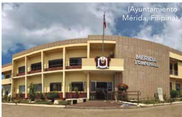
(Ayuntamiento Mérida, Filipina)

Mérida es la capital del estado homónimo y se destaca como una de las principales localidades de Los Andes, rodeada por majestuosas montañas verdes que brindan escenarios dignos de hermosas postales, con atractivos naturales y arquitectónicos tan hermosos que la han convertido en uno de los destinos turísticos más destacados de Venezuela. La ciudad cuenta con edificios coloniales notables, como la Catedral, el Palacio Arzobispal y la sede de la Universidad de Los Andes, la institución más antigua del país andino; además, los visitantes pueden apreciar las cadenas montañosas en el Parque