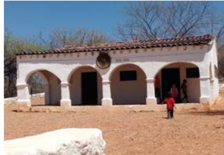
La casa en la que nació Guadalupe Victoria en Tamazula, Durango

En Veracruz, Guadalupe Victoria lideró a los insurgentes controlando el Puente del Rey, un punto estratégico que unía a Xalapa con el Puerto donde emboscaban las caravanas que transportaban fondos y armas traídas desde España; aunque se fortificó esta posición, sus