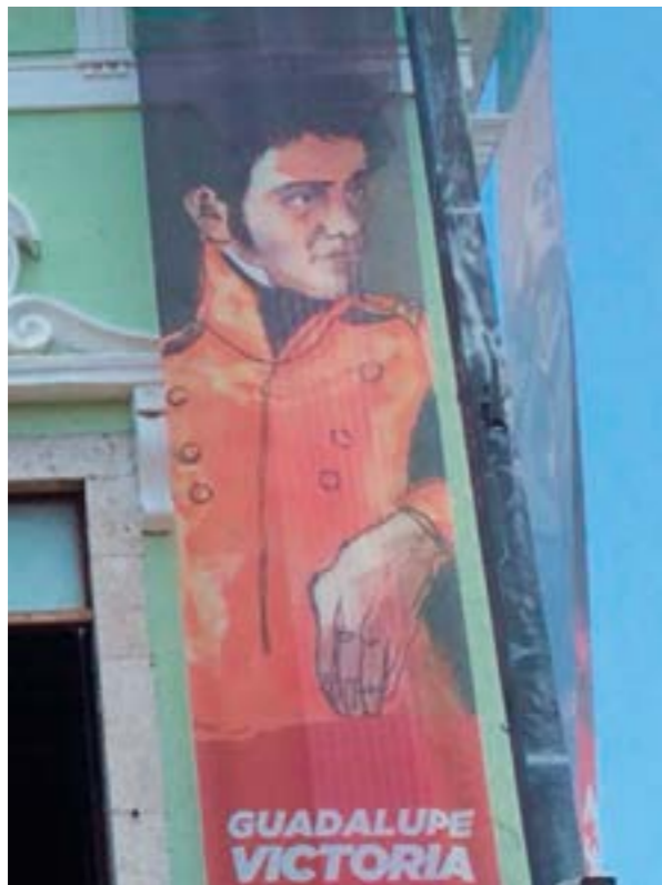
Recordatorio de que, en 2018, el gobierno local se confundió y puso la foto de Santa Anna en lugar de la que debería ser.

Posteriormente fue creado un gobierno provisional encabezado por Nicolás Bravo, Pedro Negrete y Victoria (quien se mantuvo en Veracruz para encabezar la resistencia desde San Juan de Ulúa), que reorganizó al país y, en 1824, se proclamó una nueva constitución y se organizaron las primeras elecciones federales, de la cual salió elegido Guadalupe Victoria. Por fin la lucha había llegado a su fin.