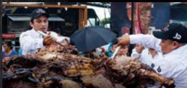
Especial Revista Yucatán

N uestro estado es famoso por la producción de carne de cerdo, de pollo y, por supuesto, los mariscos, pero cuando se habla de la carne de res, poca fe se le tiene; no obstante, la región oriente ha alzado la mano para abrirse paso entre los consumidores, logrando destacar incluso por encima de productores de la zona norte del país y los Estados Unidos. Con esto en mente, un grupo de apasionado por la ganadería empezó el año pasado un proyecto que se antoja para que se convierta en una tradición anual en la entidad: el Festival de la Carne.