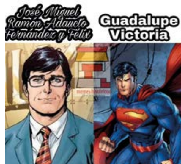
En ocasiones, los memes pueden ser muy educativos

En ocasiones, los mexicanos tendemos a sentirnos pesimistas analizando la historia nacional, viendo sus eventos como ejemplos de mezquindad e ineptitud. Esto ocurre especialmente al considerar la Independencia y la Revolución, que aparentemente no llevaron a la nación deseada. Sin embargo, la historia de México ha sido difícil y distinta a la de otros países, sin una transición clara hacia una sociedad mejor. Cada avance hacia la justicia ha requerido sacrificio y esfuerzo, y México es una lucha constante por la independencia, una república federal, un estado secular y una sociedad igualitaria. A lo largo de esta lucha, figuras como Guadalupe Victoria han desempeñado un papel crucial en el progreso del país.