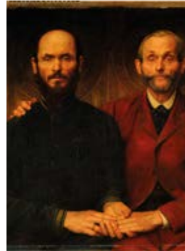
Amistad (1896), Jef Leempoels